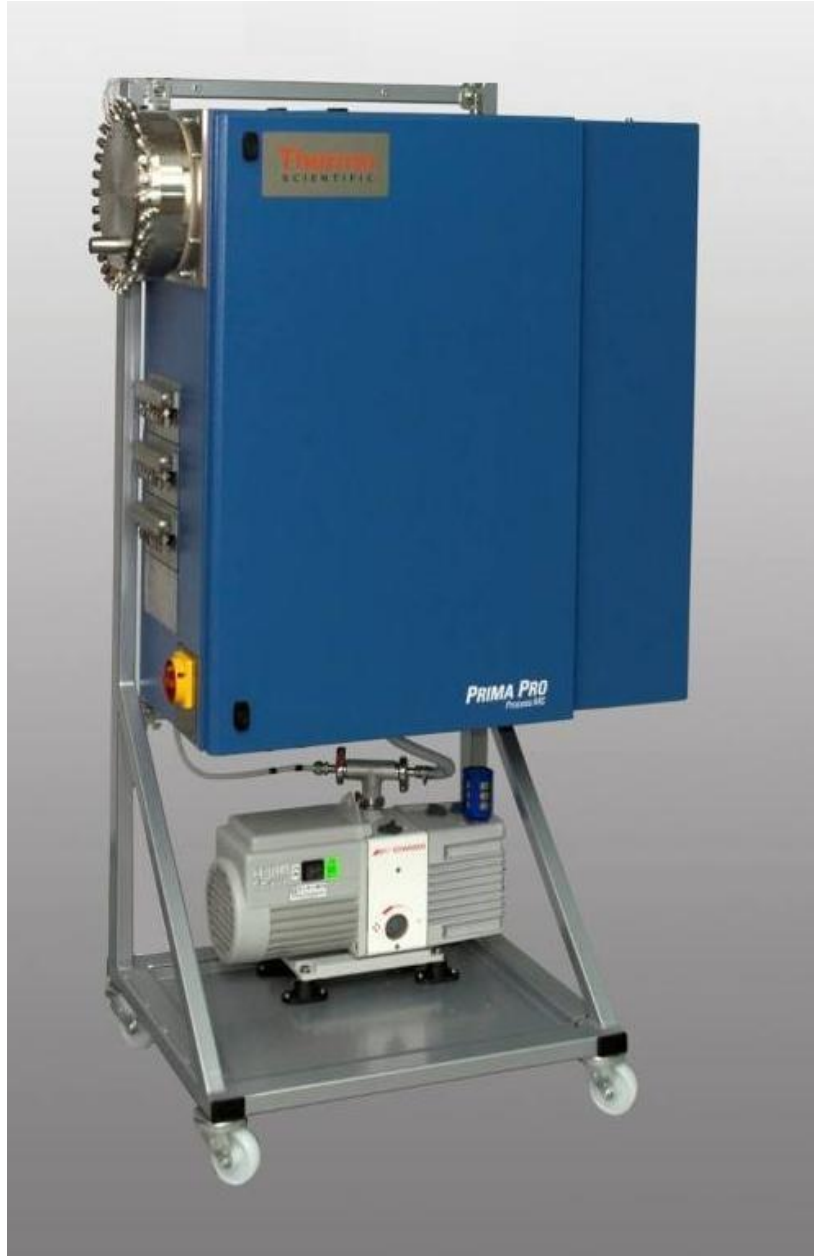
Thermo Fisher Scientific Prima PRO

Thermo Fisher SCIENTIFIC shortlisted BEQA 2010 british engineering excellence awards